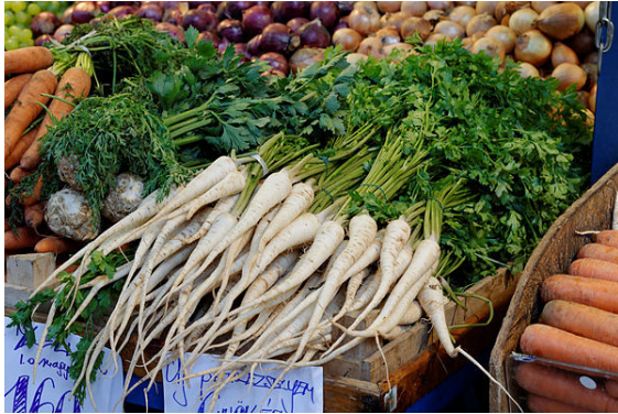
Wurzelpetersilie auf einem Markt in Budapest

Die Wurzelpetersilie ( Petroselinum crispum subsp. tuberosum ), auch Knollenpetersilie oder Petersilienwurzel genannt; in Österreich auch Peterwurz, ist eine Unterart der Petersilie ( Petroselinum crispum ) mit verdickter, länglich, spitz zulaufender Rübe . Sie gehört zur botanischen Familie der Doldenblütler (Apiaceae).